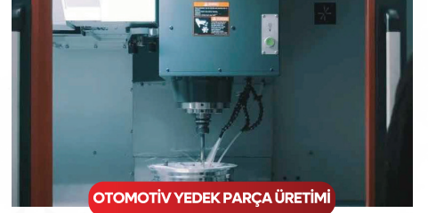
OTOMOTİV YEDEK PARÇA ÜRETİMİ