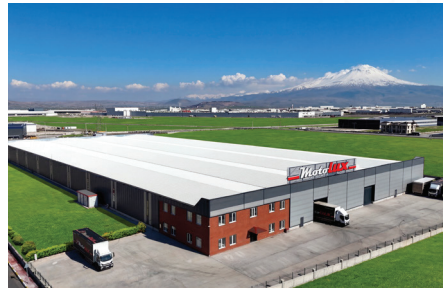
ATV-UTV-GOLF ARACI FABRİKASI

Atv-Utv and Golf Vehicle Production Factory