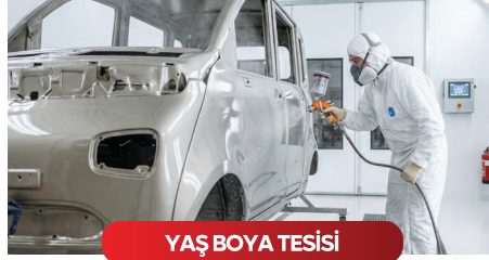
YAŞ BOYA TESİSİ