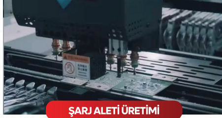
ŞARJ ALETİ ÜRETİMİ