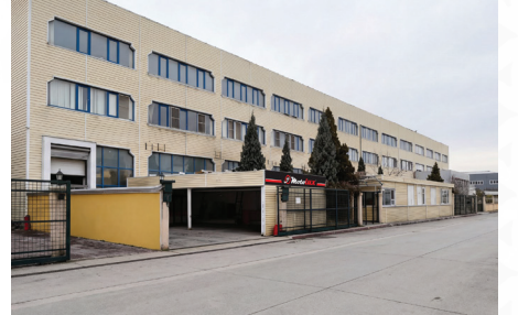
KONYA OTOMOTİV YEDEK PARÇA FABRİKASI