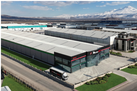
ELEKTRİKLİ ARABA FABRİKASI