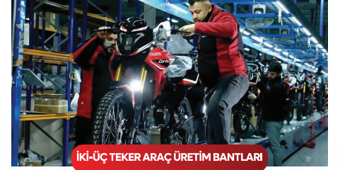
İKİ-ÜÇ TEKER ARAÇ ÜRETİM BANTLARI